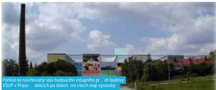
Pohled na navrhovaný stav budoucího vstupního přízemí budovy VŠUP v Praze - obcích po dokončení všech etap výstavby